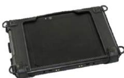
Schutztasche für 8 oder 10 Zoll (ohne Rugged Frame Schutzrahmen)