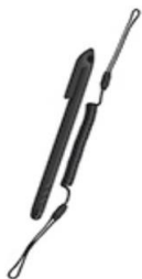
Stylus / Bedienstift passive und aktive Varianten