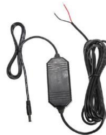
12V Fahrzeug-Ladekabel mit offenen Enden