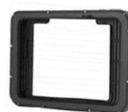
Rugged Frame Schutzrahmen für 8 oder 10 Zoll