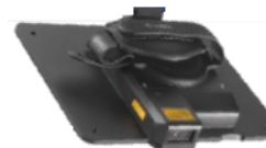
Expansion Back mit 2D Imager SE4750 oder SE4710 Für Android