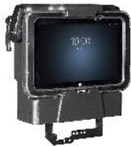
Robuste Fahrzeug Docking mit LAN/USB Anschlüssen. Ideal für Staplereinsatz. (Details siehe unten)