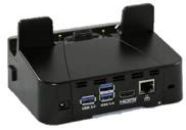
USB Single-Slot Cradle für ET50 mit oder ohne Frame