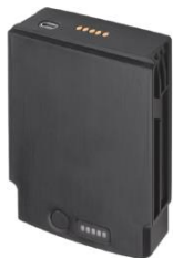
Zusatzakku, 6800 mAh für Expansion Back