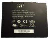
Ersatzakku, 8 Zoll, 3300 mAh. 5-6 Stunden WLAN Betrieb und Display an 4-5 Stunden WAN Betrieb und Display an