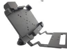
Tastatur Befestigung für Fahrzeughalterung.