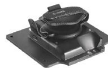
Expansion Back (Rotierender Hand Strap)