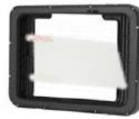
Schutzfolie 8 oder 10 Zoll (mit Rugged Frame).