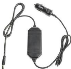
12V Fahrzeug-Ladekabel mit Zigarettenanzünder- Adapter