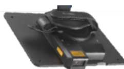
Expansion Back mit 2D Imager SE4750 oder SE4710 Für Windows