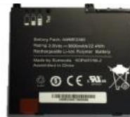
Ersatzakku 10 Zoll, 4950 mAh. 8-9 Stunden Betrieb und Display an 7-8 Stunden Betrieb und Display an